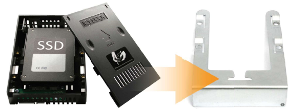
ICY DOCK EZConvert MB882SP-1S-2B