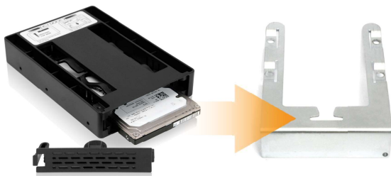
ICY DOCK EZConvert MB882SP-1S-3B